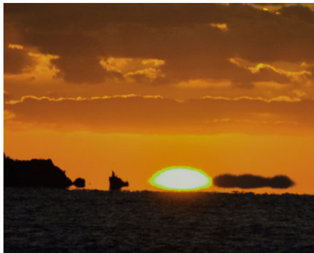
グリーンフラッシュ 柳原の堤防から

久しぶりに天気が良く冷え込みがきつかったので、ダルマタ日を写しに出かけました。日没直前にグリーンフラッシュが数秒間見えました。いつかは見られるかなと思っていたのですが、やっと見ることができました。これで、