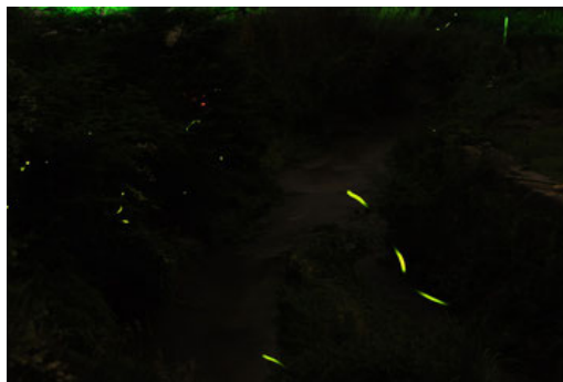
緑の光がホタルです

雨が止んだ ので五明へ ホタルを見 にいきました。 昨日か らの大雨で ホタル祭 りは中止、 ホタルも 流されて (地元 の人の話) 少ないと のことです。 それでも 8時頃 から川