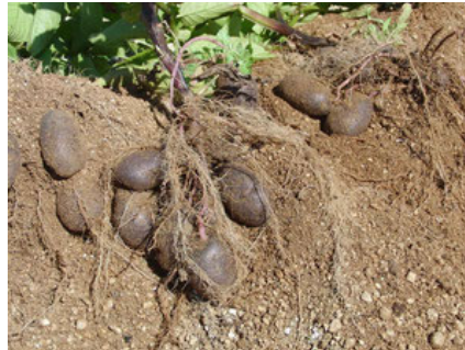
シャドークイーン

梅雨の合間にジャガイ モの収穫です。今年 は、いつものレッド ムーンと新しく黒い ジャガイモ（中身は 紫）のシャドークイ ーンの2品種です。ま あま豊作かな？ 味は レッドムーンは◎で すが、シャドークイ ーンは△。調理方法を考 えないといけないかも。